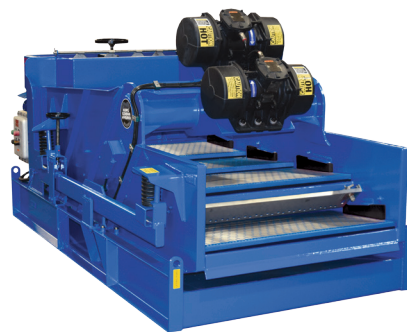
Вибросито KING COBRA HYBRID с системой автоматической регулировки силы G (CONSTANT G-CONTROL™ - CGC)

В конструкции вибросита KING COBRA HYBRID надежность рамы и приемного резервуара, а также функции регулировки угла наклона сеток, присущие виброситу KING COBRA, сочетаются с прочностью корзины вибросита KING COBRA VENOM. Запатентованная конструкция корзины CONTOUR PLUS™ позволяет оптимально распределить раствор на сеточных панелях для обеспечения лучшего удаления твердых частиц из бурового раствора. Конструкция CONTOUR PLUS с подающей панелью под углом 0° и остальными панелями, расположенными под углом +5°, позволяет снизить до минимума угол подъема корзины. Кроме того, она увеличивает эффективность сепарации и срок службы сеток за счет оптимального распределения раствора.